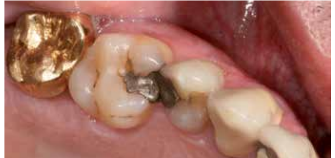
Klassisches Szenario: Goldkrone neben Amalgamfüllung – der Batterieeffekt.

unspezifische Symptome wie Stechen oder Druck in der Brust, unerklärtes Herzrasen, Tinnitus und Hörverlust, etc. sein [50].