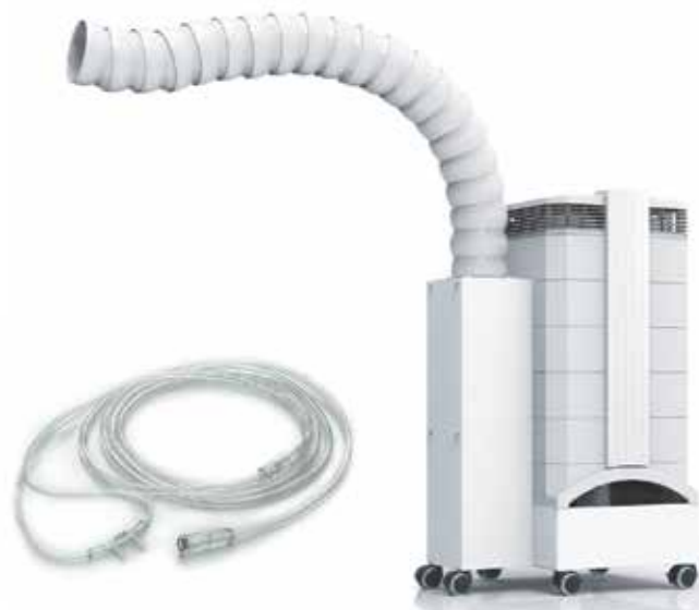
Kofferdamm, Sauerstoff-Zufuhr, CleanUp Sauger, IQ-Air und Mikronährstoffe